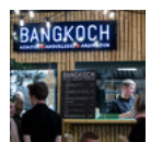
Åbning Aarhus Central Food Market